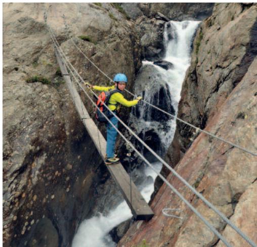
Die 1. Seilbrücke

Charakteristik: Es ist schon eine weite Anfahrt zum Holderli-Seppl-Klettersteig im Kaunertal. Wer dennoch hierher kommt wird allerdings nicht enttäuscht: Ein abwechslungsreicher und nicht allzu langer Klettersteig! Immer über dem tosenden Riffler-Gletscherbach, dazu umrahmt von 3000ern. Eine Tour für die ganze Familie! Tipps: Da man schon die Maut gezahlt hat, sollte man auf alle Fälle die Mautstraße auch bis zum Ende durchfahren. Wer einsame Klettersteige sucht, wird hier fündig.