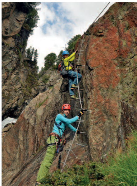
Nach der 2. Seilbrücke (links) und die Steilstufe mit den Bügeln