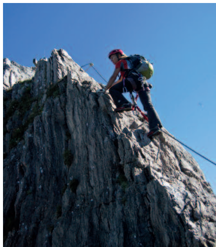
Marokka-Klettersteig: links der letzte Steilaufschwung, rechts die kurze Kante zum Gipfel (F. K. Schall)