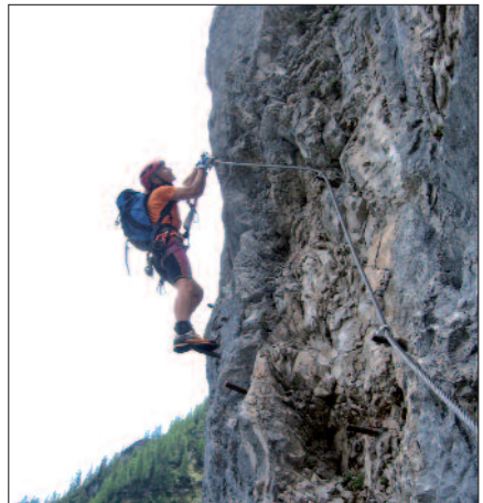
Erster Steilaufschwung

Im Gesamten gesehen nicht ganz so schön und etwas leichter wie der in der Silberkarklamm startende Hias-Klettersteig .