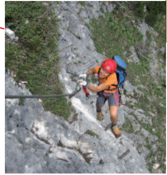
Im erdigen oberen Teil