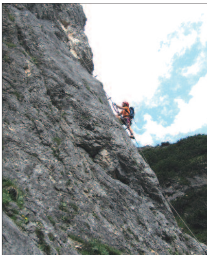
In der Einstiegsplatte

Abstieg: 1 Std. Vom Ausstieg nach rechts, kurz absteigen (A/B), dann dem ausgeschnittenen Latschensteig folgen zu einem Bachbett, welches überquert wird. Danach kurz absteigen (gesichert, A/B) und dem Steig folgend zum rot markierten Wanderweg Nr. 619, über welchen man weiter absteigt zur Hütte. Weiterer Abstieg wie Zustieg.