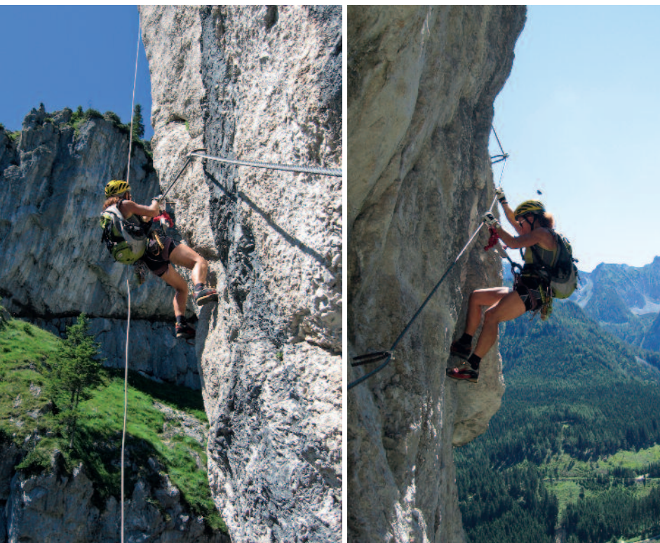
Geiler Hengst, links beim Pfeiler (D/E), rechts in oberen Teil (D/E)

Abstieg: 40 Min. Zunächst steiler, gesicherten Abstieg (B) links in die grasige, breite Rinne am oberen Ende der Schlucht. Diese überqueren und gegenüber dem Sicherungsseil folgend (A) kurzer Aufstieg zu einem Absatz. Von hier gesicherter Abstieg (A bis B) und tw. absteigende Querungen (A bis B) in eine Rinne, in welcher man ca. 100 m ungesichert absteigt, bis die Sicherungen wieder beginnen. Querend absteigen (A) und zuletzt noch einmal steil abwärts (B) zum Wandfuß in einer Schlucht. Dem Geröllsteig links bergab folgen und zurück zur Hengstpass-Straße.