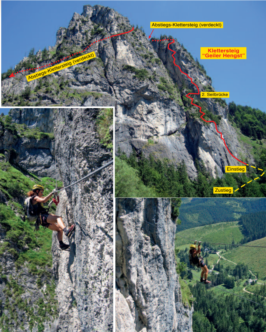
Geier Hengst , links die Schlüsselpassage (E), rechts die Zweiseilbrücke

Anreise: Von Osten (Altenmarkt bei St. Gallen) kommend auf der Hengstpass-Straße bis ca. 1 km nach dem Gasthof „Sagwirt“. Hier befindet sich auf der linken Straßenseite ein kl. Parkplatz bei einem markanten, großen Felsblock (ca. 100 m danach die Abzweigung links zur Jausenstation „Laussabauernalm“ - auch hier an der Hauptstraße Parkmöglichkeiten). Von Westen (Windischgarsten) kommend Auffahrt zum Hengstpass (Hinweistafeln) und dann etwa 4 km abwärts bis zur Abzweigung der Schotterstraße zur „Laussabauernalm“ (Tafel). Ca. 100 m danach (unterhalb) rechts der kl. Parkplatz beim großen Felsblock. Bahn / Bus: Bhf. Windischgarsten und mit dem Bus über den Hengstpass bis zur Haltestelle „Laussabauernalm“.