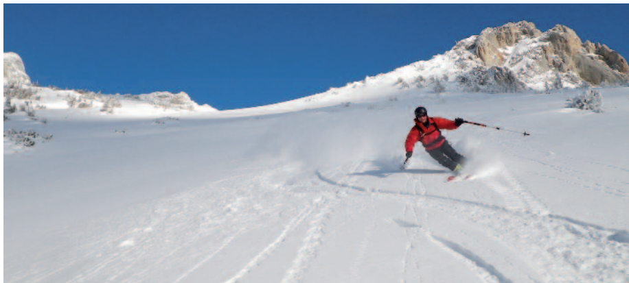
Weiss, Schall, Kärntner u. Osttiroler Bergführer, NP Hohe Tauern